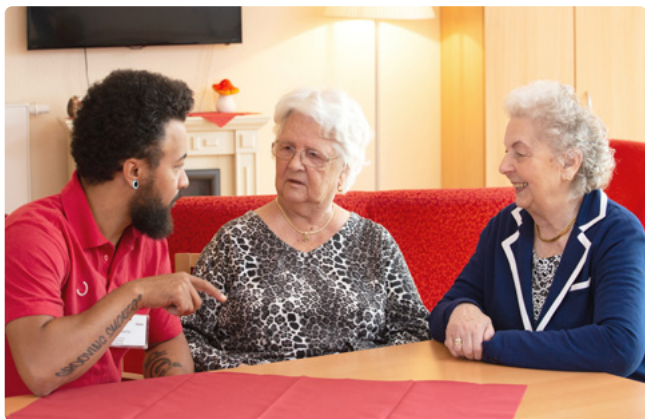
Entlastung für Angehörige und Pflegepersonen