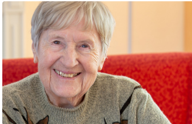
Gut aufgehoben in der Kurzzeitpflege