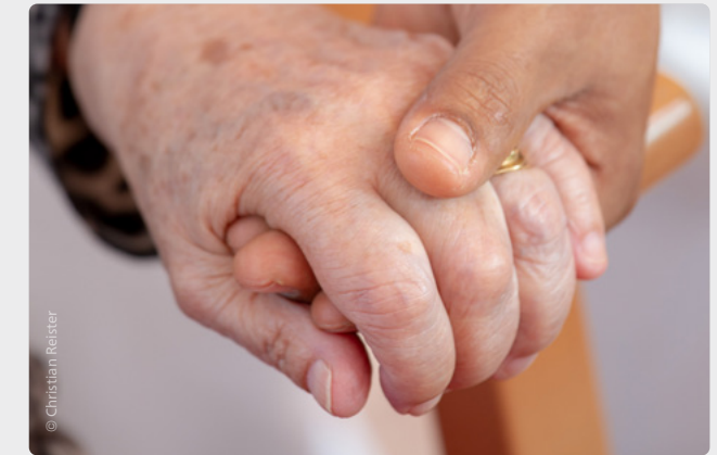
Ein würdiges und beschwerdearmes Leben bis zuletzt