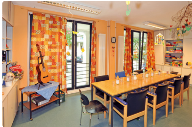
Freundlich gestaltete Gruppenräume