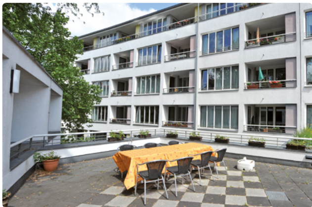
Eine Sonnenterrasse des Hauses