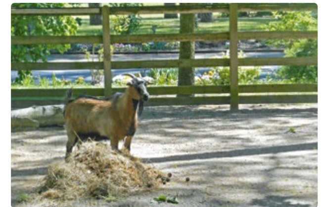
Ziegengehege des Hauses