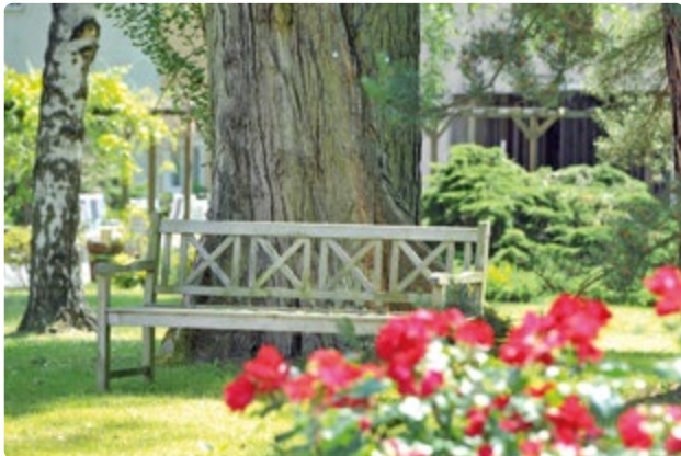
Ruhig und umgeben von Natur liegt unser Haus