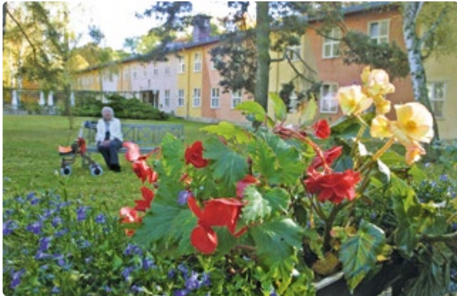
Mitten im Grünen, abseits der hektischen Großstadt

Zwischen Havel und Sacrower See liegt das Hauptstadtpflege Haus Ernst Hoppe, idyllisch inmitten von Wäldern. Wie der Stadtteil Kladow ist auch unsere Pflegeeinrichtung mit drei Gebäuden eher ruhig und umgeben von harmonischer Natur. Hier können Sie entspannen und die Natur genießen.