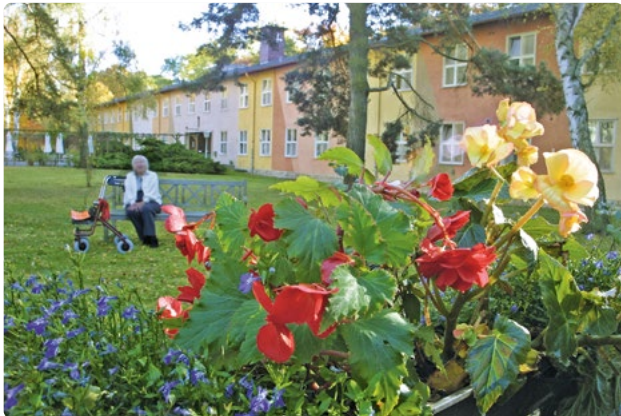
Mitten im Grünen, abseits der hektischen Großstadt