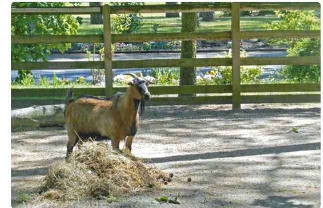
Ziegenhege des Hauses