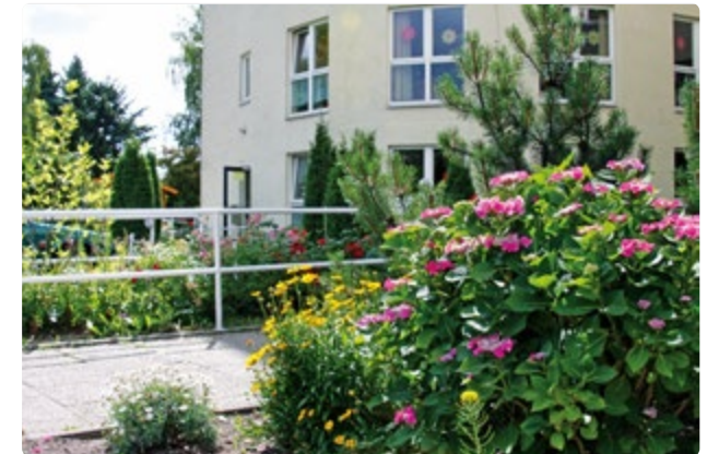
Haupteingang des Hauses