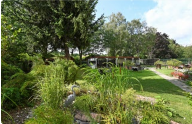
Das Haus liegt ruhig mit Blick ins Grüne

Idyllisch im Grünen liegt das Tempelhofer Hauptstadtpflege Haus Franckepark. Hier finden Bewohner*innen Ruhe und Geborgenheit. In der großen Gartenanlage des denkmalgeschützten Hauses lässt sich herrlich entspannen. Tiergehege, ein Hochbeet zur Blumen- und Kräuterpflanze sowie ein Teich mit gemütlichen Sitzinseln zeichnen die Einrichtung aus. Und in wenigen Gehminuten sind auf dem Tempelhofer Damm viele Geschäfte erreichbar.