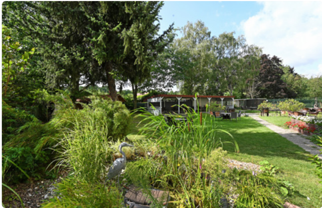
Das Haus liegt ruhig mit Blick ins Grüne

Idyllisch im Grünen liegt das Tempelhofer Hauptstadtpflege Haus Franckepark. Hier finden Bewohner*innen Ruhe und Geborgenheit. In der großen Gartenanlage des denkmalgeschützten Hauses lässt sich herrlich entspannen. Tiergehege, ein Hochbeet zur Blumen- und Kräuterpflanze sowie ein Teich mit gemütlichen Sitzinseln zeichnen die Einrichtung aus. Und in wenigen Gehminuten sind auf dem Tempelhofer Damm viele Geschäfte erreichbar.