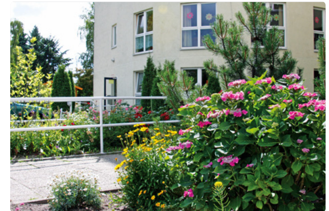
Haupteingang des Hauses