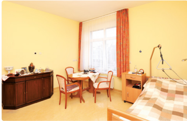
Die Zimmer können individuell gestaltet werden

Das Haus Ida Wolff in Berlin-Neukölln gibt seit mehr als 30 Jahren vielen Menschen ein Zuhause, in dem sie sich sicher und geborgen fühlen können. Es liegt auf dem Gelände des Vivantes Klinikum Neukölln und kooperiert mit dort niedergelassenen Ärzt*innen. Die in unmittelbarer Nähe liegenden Gropius Passagen laden zum Spaziergang und Bummeln ein.