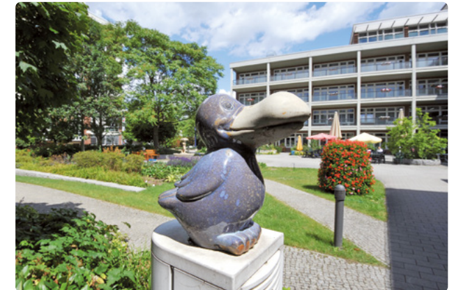
Ein Innenhof lädt zum Verweilen ein