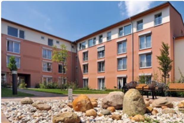
Geschützter Innenhof des Hauses