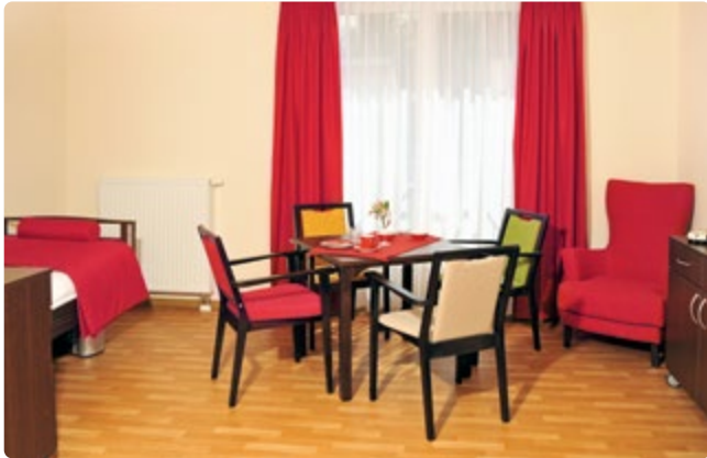
Zimmer können individuell eingerichtet werden

Das Hauptstadtpflege Haus John F. Kennedy wurde 2010 eröffnet und liegt in Alt-Wittenau, einem ruhigen Wohngebiet. Es besteht aus zwei miteinander verbundenen Gebäudeteilen. Neben dem allgemeinen Pflegebereich finden Sie im Haus John F. Kennedy ebenfalls einen gerontopsychiatrischen Pflegebereich. Einkaufsmöglichkeiten sind in der Nähe vorhanden.