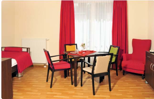
Zimmer können individuell eingerichtet werden

Das Hauptstadtpflege Haus John F. Kennedy wurde 2010 eröffnet und liegt in Alt-Wittenau, einem ruhigen Wohngebiet. Es besteht aus zwei miteinander verbundenen Gebäudeteilen. Neben dem allgemeinen Pflegebereich finden Sie im Haus John F. Kennedy ebenfalls einen gerontopsychiatrischen Pflegebereich. Einkaufsmöglichkeiten sind in der Nähe vorhanden.