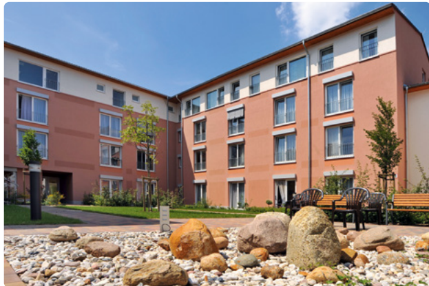
Geschützter Innenhof des Hauses