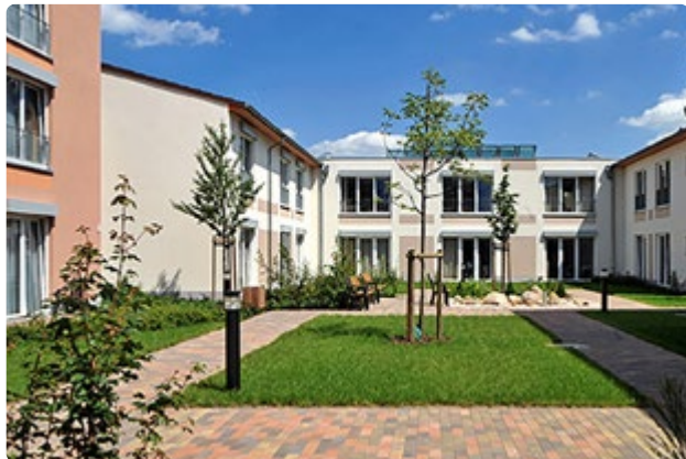
Der Innenhof unserer Einrichtung