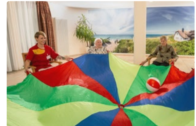
Betreuungsangebote sorgen für Abwechslung im Alltag