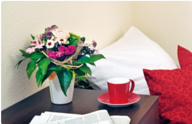
Modern und stilvoll wohnen im Haus John F. Kennedy

Das Hauptstadtpflege Haus John F. Kennedy bietet neben dem allgemeinen Pflegebereich auch einen gerontopsychiatrischen Fachpflegebereich. Hier finden Menschen mit Demenz und anderen gerontopsychiatrischen Erkrankungen ein neues Zuhause. Das moderne Haus in einem Wohngebiet in Alt-Wittenau wurde im Jahr 2010 eröffnet. Im geschützten Außenbereich steht den Bewohner*innen eine schöne Gartenanlage zur Verfügung, die ihnen die Gelegenheit zu erholsamen Spaziergängen bietet.