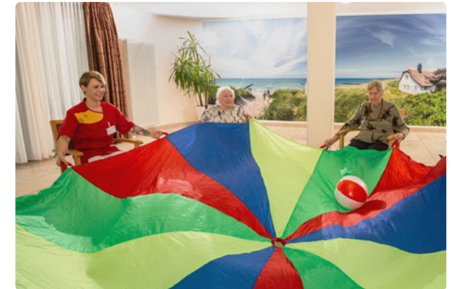
Betreuungsangebote sorgen für Abwechslung im Alltag