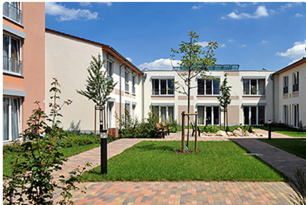
Der Innenhof unserer Einrichtung