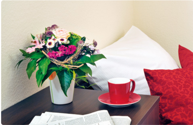
Modern und stilvoll wohnen im Haus John F. Kennedy

Das Hauptstadtpflege Haus John F. Kennedy bietet neben dem allgemeinen Pflegebereich auch einen gerontopsychiatrischen Fachpflegebereich. Hier finden Menschen mit Demenz und anderen gerontopsychiatrischen Erkrankungen ein neues Zuhause. Das moderne Haus in einem Wohngebiet in Alt-Wittenau wurde im Jahr 2010 eröffnet. Im geschützten Außenbereich steht den Bewohner*innen eine schöne Gartenanlage zur Verfügung, die ihnen die Gelegenheit zu erholsamen Spaziergängen bietet.