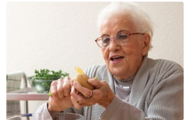
Betreuung und Pflege orientieren sich im Haus Dr. Hermann Kantorowicz an den individuellen Bedürfnissen