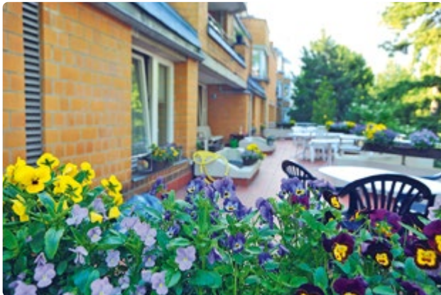
Eine Terrasse und ein Garten gehören zum Haus