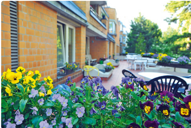
Eine Terrasse und ein Garten gehören zum Haus