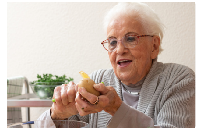
Betreuung und Pflege orientieren sich im Haus Dr. Hermann Kantorowicz an den individuellen Bedürfnissen