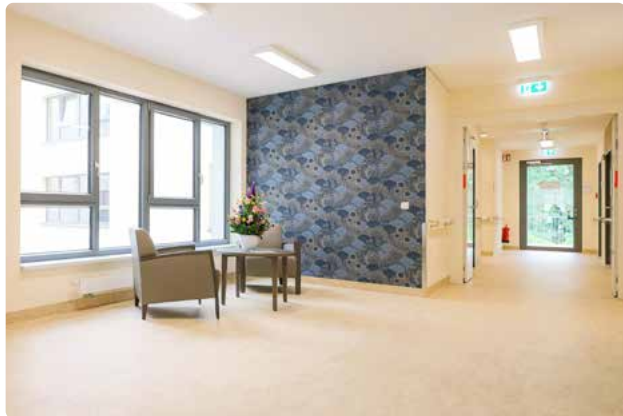
Große Fenster sorgen für lichtdurchflutete Räume