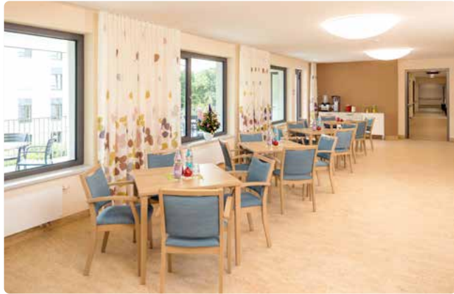
Wohn- und Esszimmer mit angeschlossener Außenterrasse

Das Haus Kaulsdorf befindet sich mitten im Bezirk Marzahn-Hellersdorf in einer ruhigen Wohngegend und wurde erst 2021 eröffnet. Eine moderne Einrichtung, viele Fenster und ein ausgewogenes Farbkonzept sorgen für eine helle und freundliche Atmosphäre. Es entspricht neuesten Pflegestandards und liegt auf dem Gelände des Klinikums Kaulsdorf.