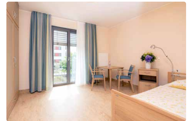
Moderne, geräumige Zimmer erwarten Sie