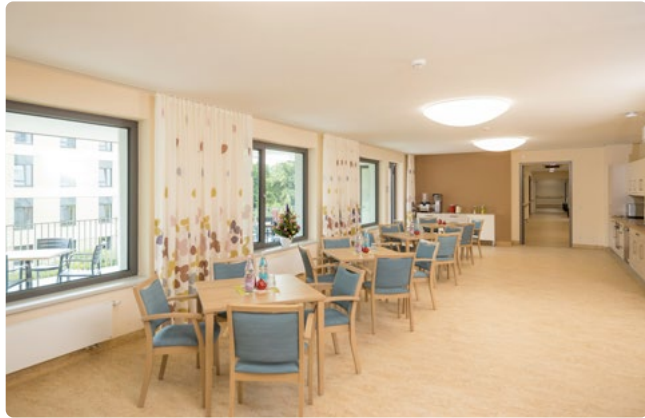
Wohn- und Esszimmer mit angeschlossener Außenterrasse

Das Haus Kaulsdorf befindet sich mitten im Bezirk Marzahn-Hellersdorf in einer ruhigen Wohngegend und wurde erst 2021 eröffnet. Eine moderne Einrichtung, viele Fenster und ein ausgewogenes Farbkonzept sorgen für eine helle und freundliche Atmosphäre. Es entspricht neuesten Pflegestandards und liegt auf dem Gelände des Klinikums Kaulsdorf.