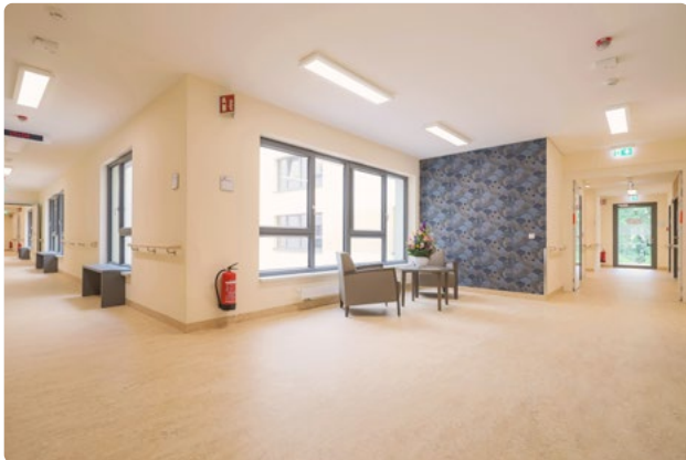
Große Fenster sorgen für lichtdurchflutete Räume