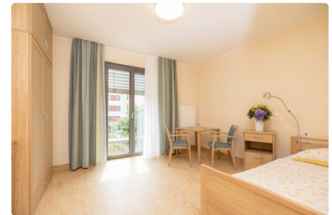
Moderne, geräumige Zimmer erwarten Sie