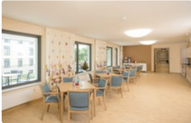
Wohn- und Esszimmer mit angeschlossener Außenterrasse

Das Haus Kaulsdorf befindet sich mitten im Bezirk Marzahn-Hellersdorf in einer ruhigen Wohngegend und wurde erst 2021 eröffnet. Eine moderne Einrichtung, viele Fenster und ein ausgewogenes Farbkonzept sorgen für eine helle und freundliche Atmosphäre. Es entspricht neuesten Pflegestandards und liegt auf dem Gelände des Klinikums Kaulsdorf.