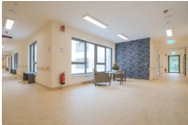
Große Fenster sorgen für lichtdurchflutete Räume