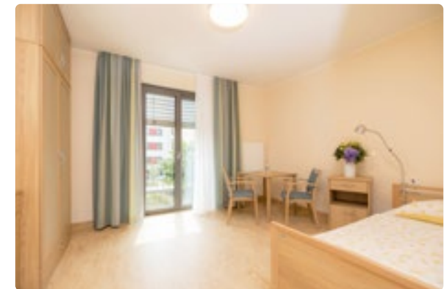
Moderne, geräumige Zimmer erwarten Sie