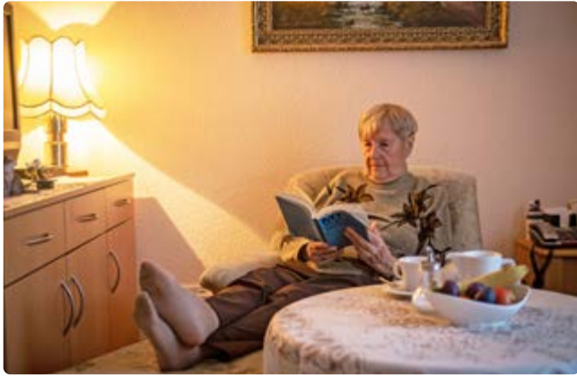
Die Zimmerausstattung kann individuell ergänzt werden

Das Haus Leonore ist eine vollstationäre Pflegeeinrichtung im Süden Berlins. Es liegt in unmittelbarer Nähe zum Teltowkanal und dem Stadtbad Lankwitz und bietet von der großzügigen Terrasse im siebten Stock einen schönen Panorama-Ausblick über Steglitz-Zehlendorf. Der schöne Park lädt zum Spaziergehen ein. Die hier angebotene Aromapflege zählt zu einer Besonderheit des Hauses.