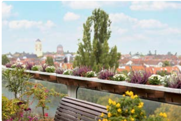
Über den Dächern Berlins