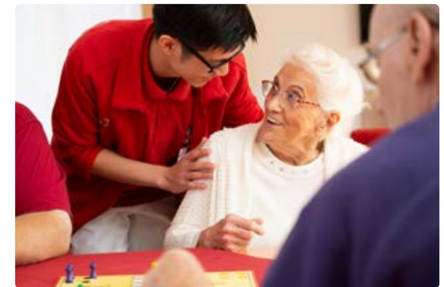
Betreuung und Pflege orientieren sich im Haus Leonore an den individuellen Bedürfnissen