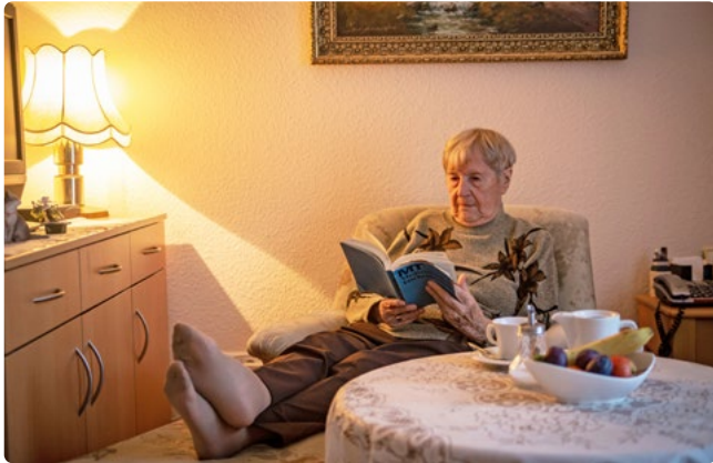
Die Zimmerausstattung kann individuell ergänzt werden

Das Haus Leonore ist eine vollstationäre Pflegeeinrichtung im Süden Berlins. Es liegt in unmittelbarer Nähe zum Teltowkanal und dem Stadtbad Lankwitz und bietet von der großzügigen Terrasse im siebten Stock einen schönen Panorama-Ausblick über Steglitz-Zehlendorf. Der schöne Park lädt zum Spaziergehen ein. Die hier angebotene Aromapflege zählt zu einer Besonderheit des Hauses.