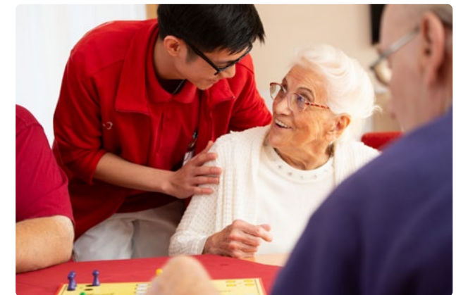
Betreuung und Pflege orientieren sich im Haus Leonore an den individuellen Bedürfnissen