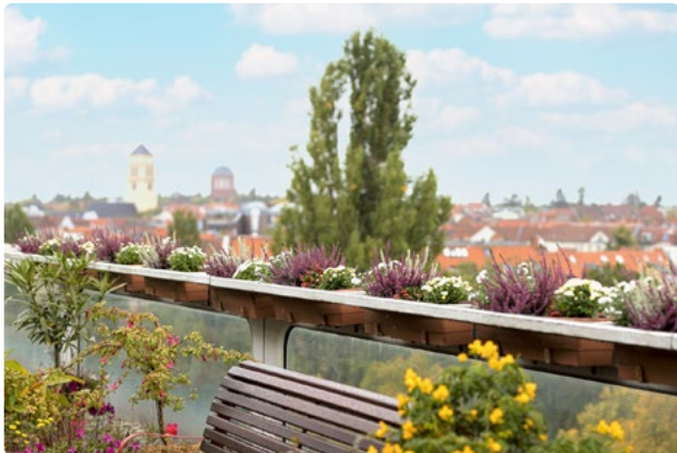
Über den Dächern Berlins