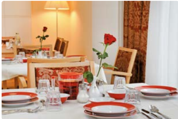
Speisen in angenehmer Atmosphäre