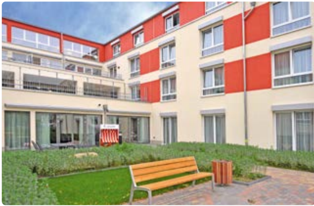
Unser im September 2013 eröffnetes Haus in Spandau

Das 2013 eröffnete Haus liegt direkt am alten Hafen Spandau und am Maselakepark. Es entspricht den neuesten Pflegestandards und bietet ein selbstbestimmtes Leben und Wohnen im Alter. Besonders sind unser Restaurant „Zur Seebrücke“ und die Terrassen mit wundervollem Ausblick. Ein parkähnlicher Garten bietet Ihnen die Gelegenheit zu erholsamen Spaziergängen mit Blick auf die Havel.