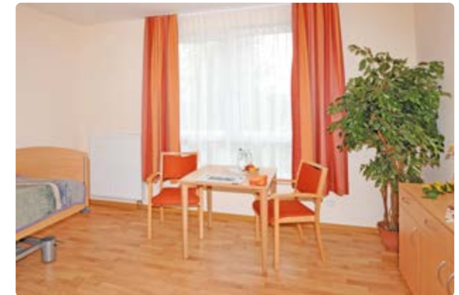
Modern ausgestattete Zimmer