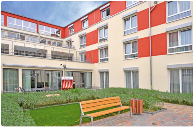
Unser im September 2013 eröffnetes Haus in Spandau

Das 2013 eröffnete Haus liegt direkt am alten Hafen Spandau und am Maselakepark. Es entspricht den neuesten Pflegestandards und bietet ein selbstbestimmtes Leben und Wohnen im Alter. Besonders sind unser Restaurant „Zur Seebrücke“ und die Terrassen mit wundervollem Ausblick. Ein parkähnlicher Garten bietet Ihnen die Gelegenheit zu erholsamen Spaziergängen mit Blick auf die Havel.