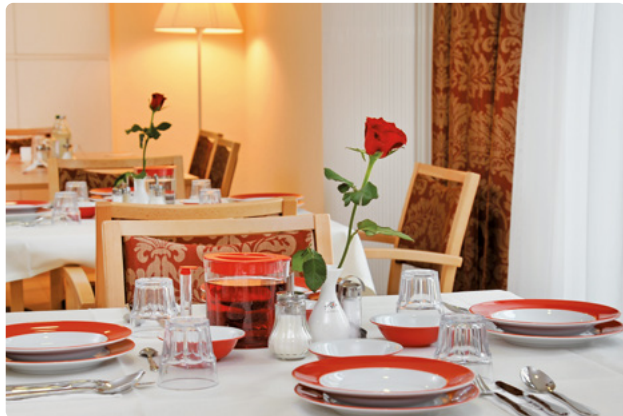
Speisen in angenehmer Atmosphäre