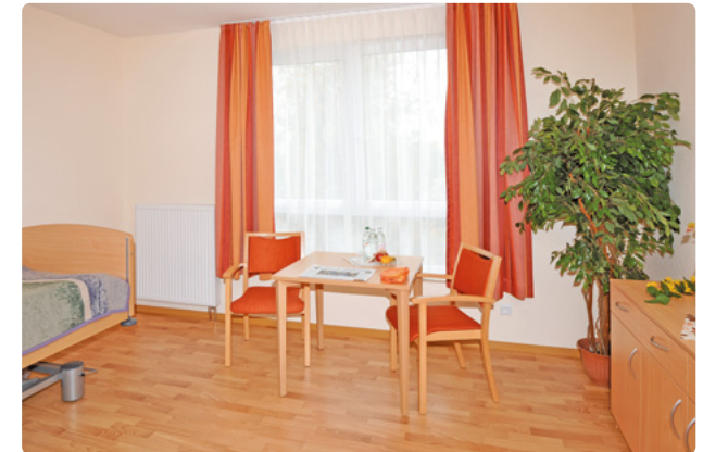
Modern ausgestattete Zimmer