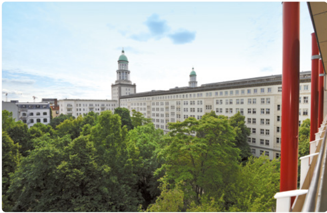
Ausblick auf die Türme des Frankfurter Tors

Das traditionsreiche Haus liegt zentral im Bezirk Friedrichshain-Kreuzberg und ist barrierefrei mit Aufzügen ausgestattet. Bei uns genießen die Bewohner*innen einen fantastischen Ausblick auf den Fernsehturm und die Türme des Frankfurter Tors. Unser parkähnlicher Garten ist ein wertvolles Stück Natur inmitten des lebendigen Bezirkes und lädt mit seinen Rundwegen und Sitzmöglichkeiten zum Verweilen ein.