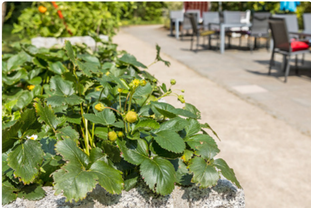
Hauseigene Erdbeeren im Garten