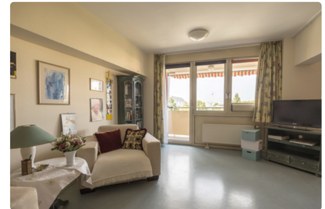
Individuell eingerichtete, geräumige Zimmer