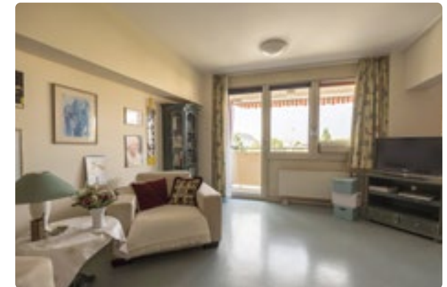
Individuell eingerichtete, geräumige Zimmer