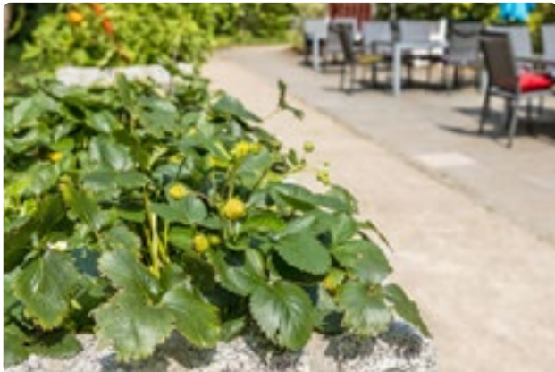
Hauseigene Erdbeeren im Garten