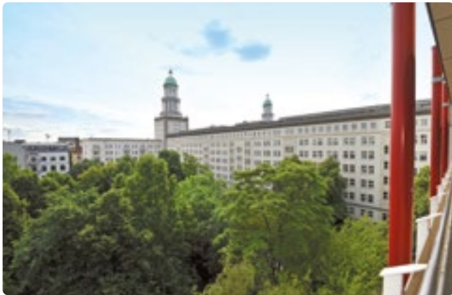
Ausblick auf die Türme des Frankfurter Tors

Das traditionsreiche Haus liegt zentral im Bezirk Friedrichshain-Kreuzberg und ist barrierefrei mit Aufzügen ausgestattet. Bei uns genießen die Bewohner*innen einen fantastischen Ausblick auf den Fernsehturm und die Türme des Frankfurter Tors. Unser parkähnlicher Garten ist ein wertvolles Stück Natur inmitten des lebendigen Bezirkes und lädt mit seinen Rundwegen und Sitzmöglichkeiten zum Verweilen ein.