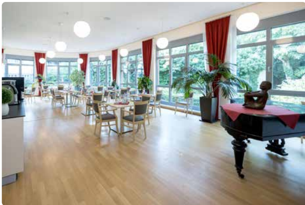
Der freundliche, helle Speisesaal des Hauses