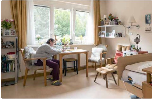
Die Zimmerausstattung kann individuell ergänzt werden

Das denkmalgeschützte Hauptstadtpflege Haus Wilmersdorf ist direkt am Hohenzollerndamm zwischen Schmargendorf und Dahlem gelegen. Der vollständig sanierte und modernisierte 3-stöckige Bau verfügt über einen großzügigen Garten mit einem idyllisch angelegten Teich und einem vielfältigen Baum- und Pflanzenbestand. Hier kann man schön spazieren gehen oder an der frischen Luft verweilen.