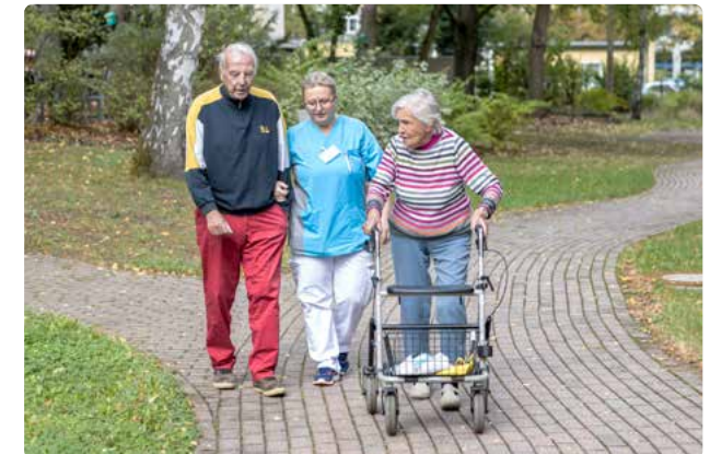
Bewohner*innen und Mitarbeitende im großzügigen Garten des Hauses